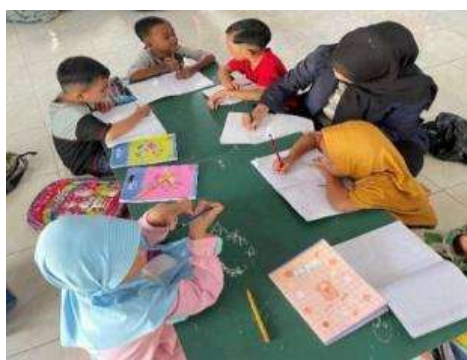
Gambar 11. Kegiatan menulis membaca