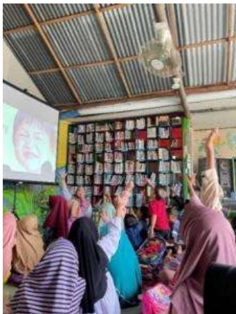
Gambar 9. Kegiatan literasi inklusif