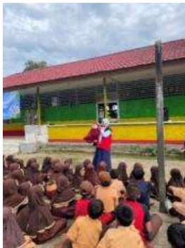
Gambar 7. kolaborasi dengan komunitas