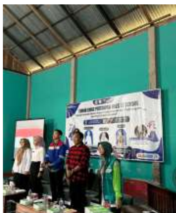
Gambar 3. Program CSR Pertamina