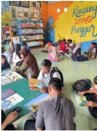
Gambar 5. jumlah pendamping yang terbata Gambar 6. suasana kelas yang kurang